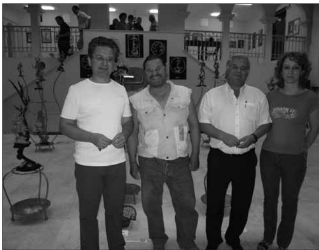
Στον εκθεσιακό χώρο της Αμφίκλειας

Αν κανείς έρθει στην Αμφίκλεια αξίζει να τους επισκεφθεί. Θα τους δείτε να εργάζονται δίπλα από ένα σωρό με πέτρες, αυτές που εμείς θα τις προσπερνούσαμε αδιάφοροι. Είναι πάντα πρόθυμοι και καλοί συζητητές. Θα σας δείξουν θα σας εξηγήσουν και όσες φορές δείτε τα έργα τους δεν θα είναι αρκετές