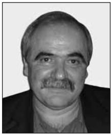
Γράφει ο Αχιλλέας Αντωνίου