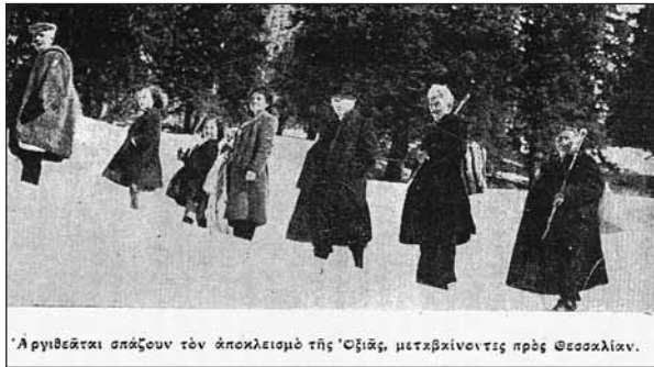
'Αργιθεάται σπάζουν τον άποικισμό της Όζιās, μετακβίνονται προς Θεσσαλίαν.'

7. Η δύναμις των κοινοτικών συμβουλίων δεν είναι η ίδια. Κοινότητες με πληθυσμό μέχρι 1.000 κατοίκων, έχουσι πενταμελή συμβούλια. Κοινότητες άνω των 1.000 κατοίκων μέχρι 2.000 κατοίκων έχουσι εξαμελή συμβούλια κ.ο.κ. Του κοινοτικού συμβουλίου προίσταται εν των μελών αυτού εκλεγόμενον δια ψηφοφορίας κατ' έτος υπό των λοιπών μελών αυτού. Η υπηρεσία του κοινοτικού συμβουλίου είναι τετραετής, η δε του Προέδρου μονοετής. Δύναται όμως να επανεκλεγεί ο Πρόεδρος ουχί όμως με τρεις ψήφους όπου εξελέγη το