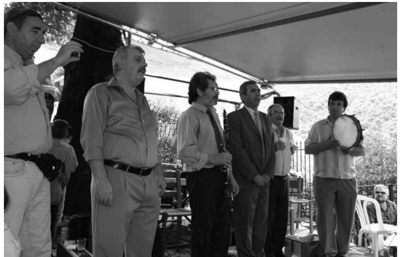
... Και με το "στόμα" μια χαρά τα πάμε...

νοί μας αποχώρησαν από το πανηγύρι, χάνοντας όμως έτσι τη μαγευτική συνέχεια. Όσοι δηλαδή παρέμειναν, το γλέντησαν για τα καλά μέχρι στις 11 το βράδυ. Σε κάθε περίπτωση ωστόσο, οι διοργανωτές του πανηγυριού οφείλουν να ζητήσουν συγνώμη από τους παρευρισκομένους για όλα όσα συνέβησαν την μέρα εκείνη που είχαν ως αποτέλεσμα να μην εξελιχθούν τα πράγματα όπως θα έπρεπε. Ας είμαστε καλά του χρόνου. Το πανηγύρι τίμησαν με την πα-