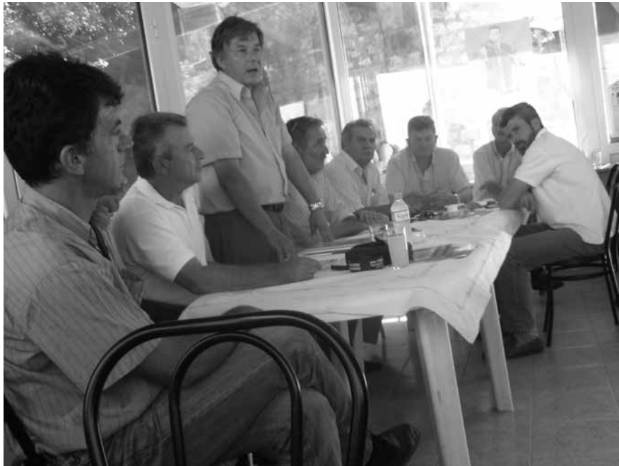
Η Ε.Γ. της ΠΣΕ στο Μάραθο

στ) Θα περιμέναμε απ' τους κ. Δημάρχους της Αργιθέας αντί να σπίνουν «εφημεριδοδικεία» να πάρουν τις εφημερίδες αυτές που τους ενόχλησαν και όλοι μαζί να τις χρησιμοποιήσουν σαν όπλα και επιχειρήματα προς τους αρμόδιους, ώστε να ξεκινήσουν κάτι θετικό για την Αργιθέα.