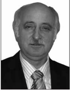
Γράφει ο Μενέλαος Νικ. Παπαδημητρίου Δικηγόρος Αθηνών - Συγγραφέας