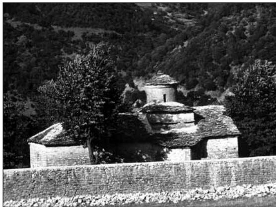
Μοναστήρι του Κώστη