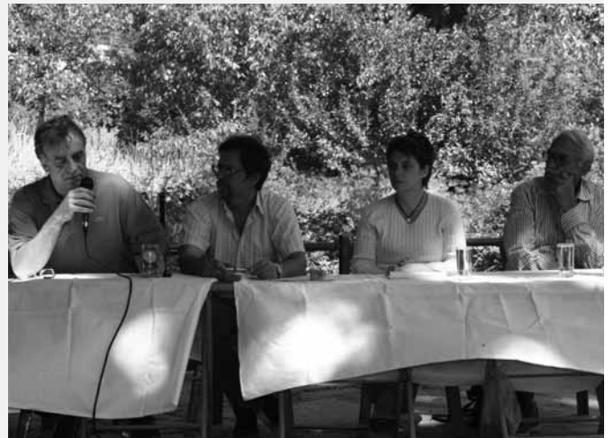
Από την ημερίδα στο Λεοντίτο

Στις αρχές του Αυγούστου που πέρασε, ο Σύλλογος Λεοντίτου διοργάνωσε για ακόμη μία φορά με μεγάλη επιτυχία ημερίδα κάτω από τον ιστορικό πλάτανο της κεντρικής πλατείας, με θέμα τις αναπτυξιακές προοπτικές που μπορούν να προκύψουν στο χωριό. Κεντρικός ομιλητής ήταν ο κ. Γούσιος, καθηγητής στο Πανεπιστήμιο Θεσσαλίας, ο οποίος μαζί με τους συνεργάτες του, παρουσίασε ένα πρωτότυπο και ιδιαίτερα ενδιαφέρον πλάνο, πάνω στο οποίο μπορούν να βασιστούν οι τοπικές κοινωνίες της επαρχίας και να προβούν, η κάθε μία ξεχωριστά και ανάλογα με τα ιδιαίτερα χαρακτηριστικά, τις ανάγκες και τις απαιτήσεις κάθε περιοχής, σε προτάσεις σχετικές με το μέλλον τους. Ουσιαστικά, ο κ. Γούσιος, προέτρεψε όχι μόνο τους λιγοστούς μόνιμους κατοίκους αλλά ιδίως όλους τους απόδημους να πάρουν την κατάσταση στα χέρια τους και να κινηθούν με αποκλειστικό γνώμονα το πώς φαντάζονται το χωριό τους μετά από κάποια χρόνια, ποια εικόνα δηλαδή επιθυμούν να εμφανίζει το χωριό τους ύστερα από μερικές δεκαετίες ή ακόμα και συντομότερα. Μάλιστα, δημιούργησε μία ομάδα δράσης, αποτελούμενη στη συντριπτική της πλειοψηφία από φοιτητές και νέους ανθρώπους του Λεοντίτου, η οποία και θα λάβει τις σχετικές πρωτοβουλίες και θα επιφορτισθεί με το βάρος της ευθύνης για την επιτυχία του πλάνου αυτού και τη διεξαγωγή των τελικών συμπερασμάτων και προτάσεων.