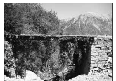
Το γεφύρι σήμερα