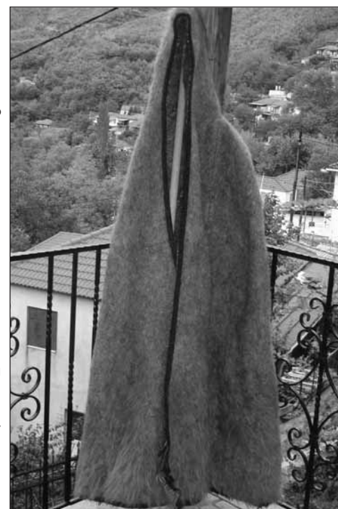
Τώρα έμειναν οι κάπες κρεμασμένες...