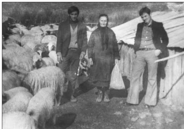
Και τα κοπάδια ξεκινάν...

Σ' αυτά τα μέρη ξεχειμάζανε σχεδόν οι περισσότεροι Αργιθεάτες, Ευρυτάνες, Ηπειρώτες κλπ. Οι υπόλοιποι πήγαιναν προς τη Θεσσαλία και μερικοί Ηπειρώτες προς τα μέρη της Παραμυθιάς. Στις επαρχίες Βόνιτσας, Ξηρομέρου, Βάλτου και Τριχωνίδος του Νομού Αιτωλοακαρνανίας, ξεχειμάζαν πάνω από εκατό χιλιάδες γιδοπρόβατα. Όταν πέρναγε ο πολύς χειμώνας, πωλούσαν τ' αρνιά και κυρίως τα αρσενικά.