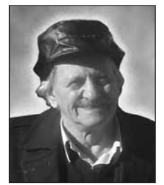
Γράφει ο Θόδωρος Α. Τσαπραΐλης

«Τι λες κουμπάρε. Κιο θα πάινε το βιολί τότε! Με την ευκαιρία να αναφέρω πως έχω πολλές «κασέτες» με τη φωνή του βιολί του μπάρμπα-Γιώργου».