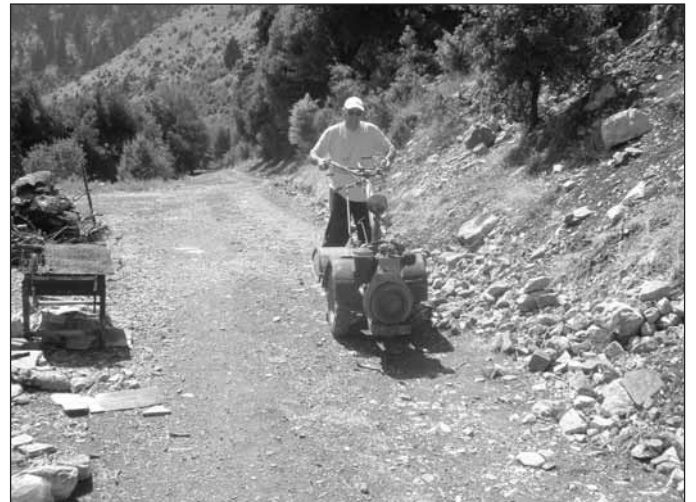
...Και η ανάπτυξη αρχίζει...