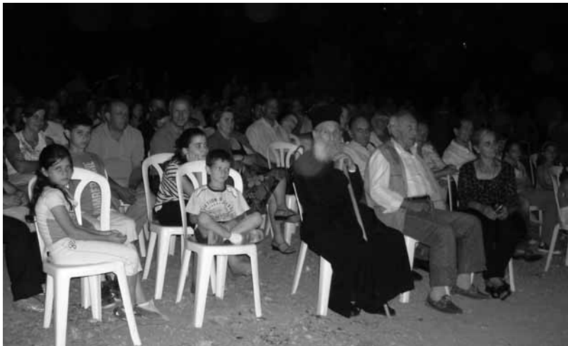
...Η θεατρική βραδιά...

Στις 9 Αυγούστου έγινε φέτος η εκδήλωση της νεολαίας μας στη λίμνη, που για τρίτη συνεχή χρονιά είχε παράλληλα και φιλανθρωπικό σκοπό. Η βραδιά ξεκίνησε με το θέατρο του κ. Νικολάου «από όλα έχει ο μπαξέζης», όπου αξίζει εδώ να αναφέρουμε πως για πρώτη φορά ανέβηκε κάποιο θέατρο στο χωριό μας. Μετά την