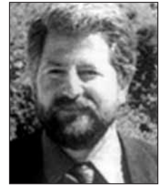
Γράφει ο Γ.Γ. Δ.Σ. ΣΥΛΛ. ΑΡΓΙΘΕΑΤΩΝ ΑΘΗΝΑΣ ΔΗΜ. ΠΑΠΑΚΩΣΤΑΣ