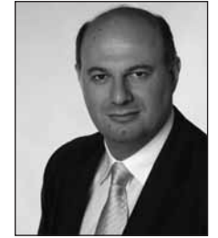
Γράφει ο Κωνσταντίνος Τσιράς Βουλευτής Καρδίτσας της Νέας Δημοκρατίας

Στο χέρι μας είναι, στο χέρι όλων μας να αξιοποιήσουμε το σήμερα για ένα πραγματικά καλύτερο αύριο.