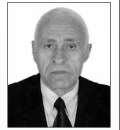
Γράφει ο Αν. Τσαπράιλης

Στου Παπαλά-Παπαλάμπρωνα Είναι ιμια μάζεψη πολλή. Καν ο παπάς-Παπαλάμπρωνα Καν ο παπάς ειν' άρρωστος Καν η παπαδιά πεθαίνει... Παπαλάμπρωνα καμμένη. Ούτ' ο παπάς ειν' άρρωστος Ούτ' ο παπάς η παπαδιά πεθαίνει Παπλάμπρωνα καμμένη. Οι κλέφτες τους- Παπαλάμπρωνα Οι κλέφτες τους εγδύσανε Και τα λεφτά ζητήσανε. Μια λυγερή Παπαλάμπρωνα Μια λυγερή εφάναζε